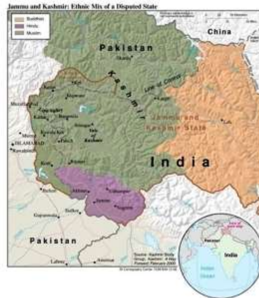
2 va 3- rasmlar

AQSh 1999, 2001/02 va 2019 yillardagi Hindiston va Pokiston o’rtasidagi keskin inqirozlarda an’anaviy “parda ortidagi” vositachi sifatida ishtirok etib kelmoqda. Ammo Donald Trampning boshchiligidagi yangi ma’muriyat boshida bu siyosatda bir oz ikkilanishlar kuzatildi. Matbuotda tarqalgan xabarlarga ko’ra, Hindiston tomonidan Pokiston qurolli kuchlari bosh qarorgohi joylashgan Ravalpindidagi harbiy bazaga qilingan hujum AQShning ushbu mojaroga faolroq aralashishiga sabab bo’ldi. Aynan shu hududda yadro qurollarini boshqaruvchi Strategik rejalar bo’limi (SPD) ham joylashgan. 2025-yil 10-may kuni Prezident Tramp o’zining Truth Social platformasida Hindiston va Pokiston o’rtasida AQSh tomonidan kelishilgan otashkesim e’lon qildi. Shuningdek, u Kashmir masalasida ikki davlat o’rtasida vositachilik qilinishini ma’lum qildi. Bu xabar Pokistonda diplomatik yutuq sifatida qabul qilinsa-da, Hindiston uchun katta siyosiy muvaffaqiyatsizlik bo’ldi. Hindiston 1972-yilda imzolangan Simla tinchlik bitimidan beri Kashmir masalasida tashqi vositachilikni qattiq rad etib keladi. Shu davr mobaynida ikki tomonlama muzokaralar ko’plab bo’lib o’tdi, ammo ularning hech biri ijobiy natija bermadi. 2016-yildagi terroristik hujumlardan so’ng Modi hukumati Pokiston terrorchilarni qo’llab-