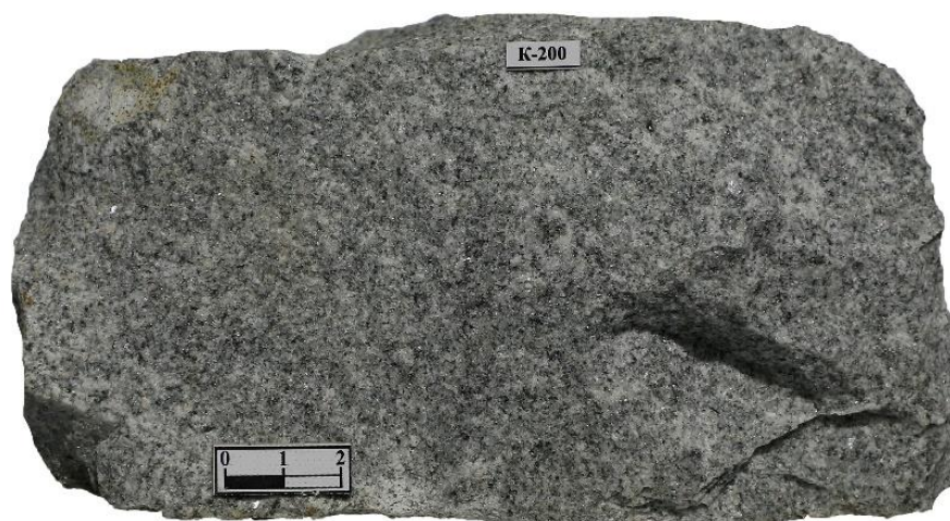
1-rasm. Biotitli leykogradit [1, 2].

Strukturasi poykilitli-gipidiomorf donador. Bunda kichik idiomorf donalar boshqa kattaroq mineralning ksenomorf kristali ichida o'simtalar hosil qilishi bilan tavsiflanadi. 2-rasmda ko'rinib turibdiki, kaliyli dala shpatining katta donasida plagioklaz, kvars, biotit va aksessor turmalinning kichikroq, idiomorfik kristallari mavjud.