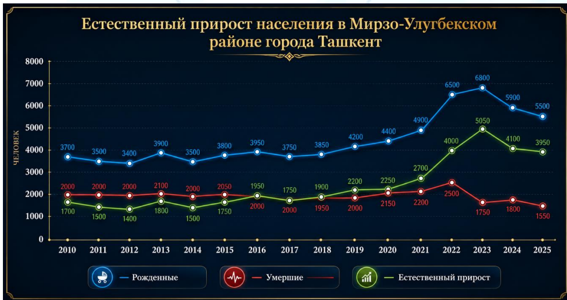
Рис.1. Естественный прирост населения в Мирзо-Улугбекском районе города Ташкента.

Что насчёт числа умерших, то по официальной статистике число умерших людей в Мирзо-Улугбекском районе постепенно уменьшается. В 2010 году всего умерло 1986 человек, а в 2025 году – 1572 человек. [4]