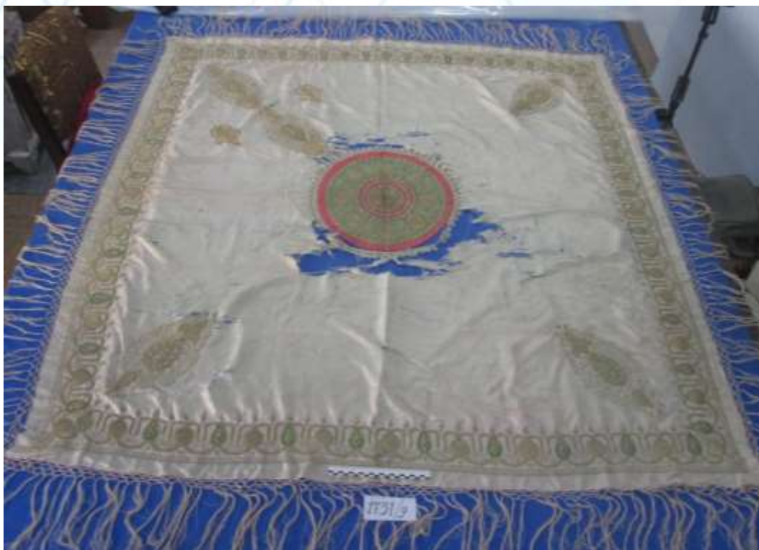
2.1-расм. Сарандоз рўмолни дазмоллаш ва тикиш жараёни