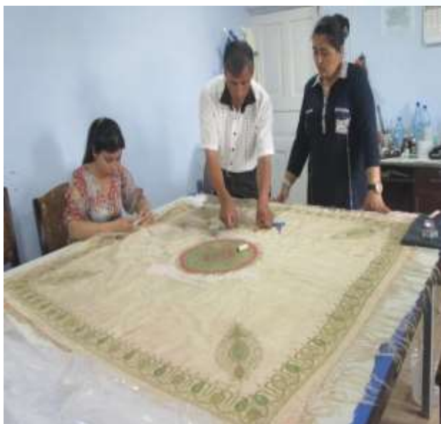
Фаранги рўмолнинг таъмирланган сурати акс эттирилган