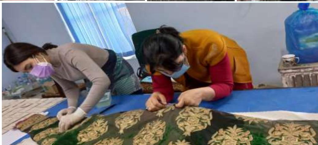
1.3 расм Бутадор тўннинг таъмирдан сўнгги ҳолати